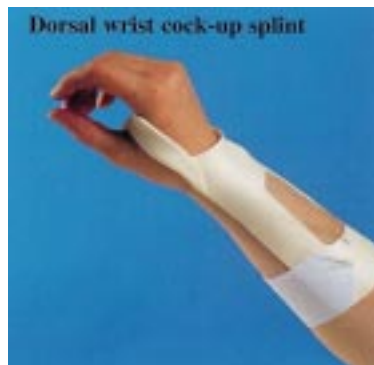
Dorsal wrist cock-up splint