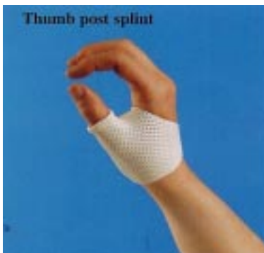
Thumb post splint

Kaikki mitä tarvitset dynaamisen rannetta ojentavan lastan valmistukseen. Materiaalina Orfit Classic Soft 3,2mm Koon valintaohje sivulla 2