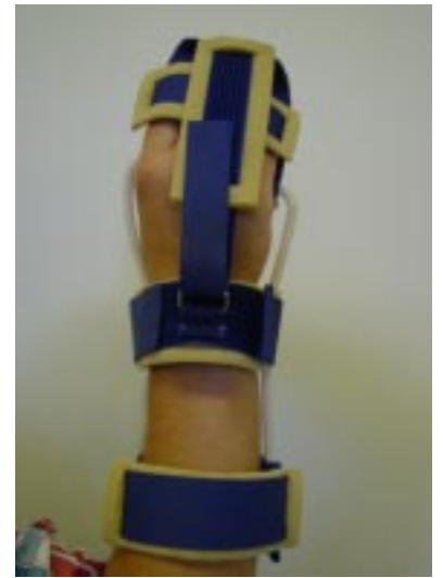
Oikein puettu Punkaharjunlasta