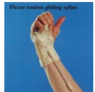
Flexor tendon gliding splint

Saatavissa erillistilauksesta myös lasta-aihiot Kleinert lyhyt